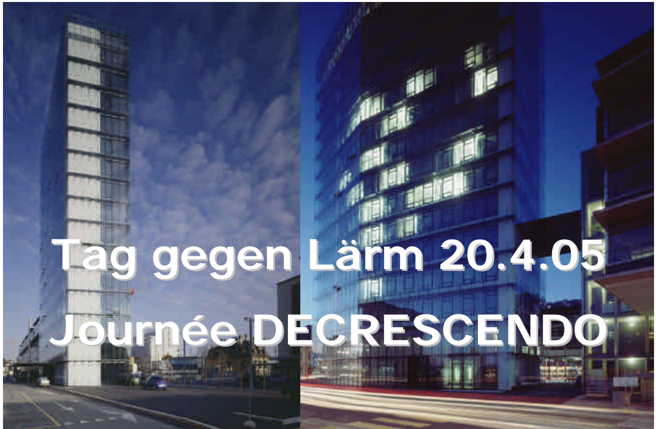
Tour OFS à Neuchâtel – jour et nuit