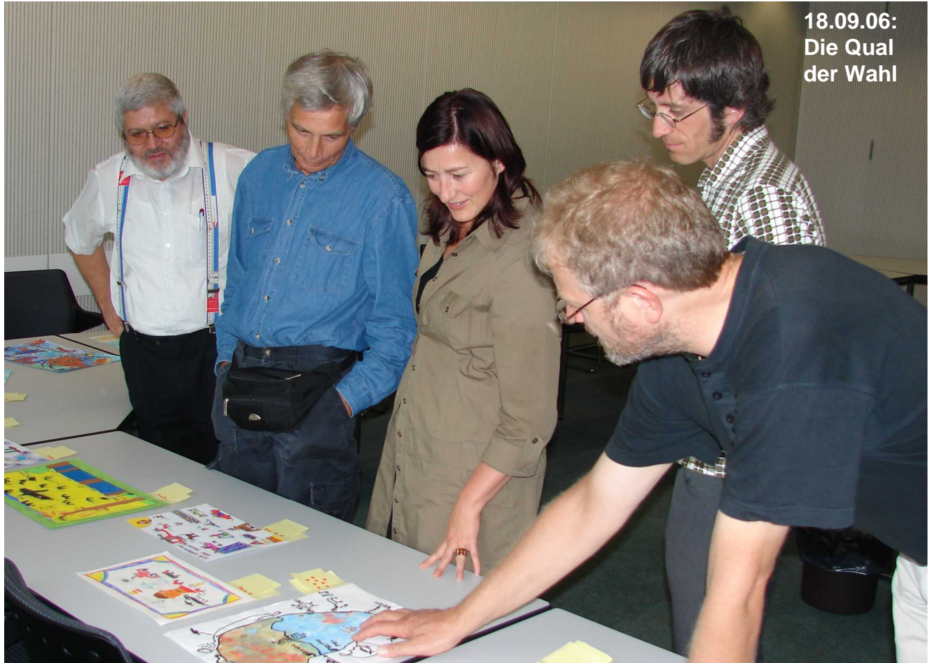
18.09.06: Die Qual der Wahl