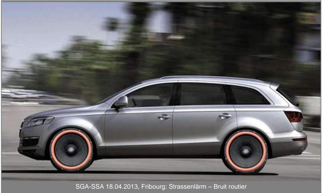
SGA-SSA 18.04.2013, Fribourg: Strassenlärm – Bruit routier