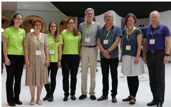
ICBEN 2017 Zürich