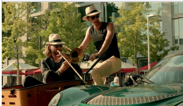
Video zum Tag gegen Lärm